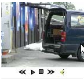
FILM de Présentation de la Recherche Action : La qualité de vie dans la commune de Marly