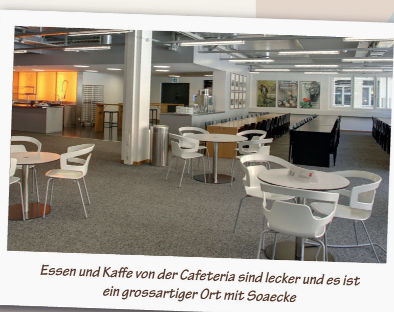
Essen und Kaffee von der Cafeteria sind lecker und es ist ein grossartiger Ort mit Soecke